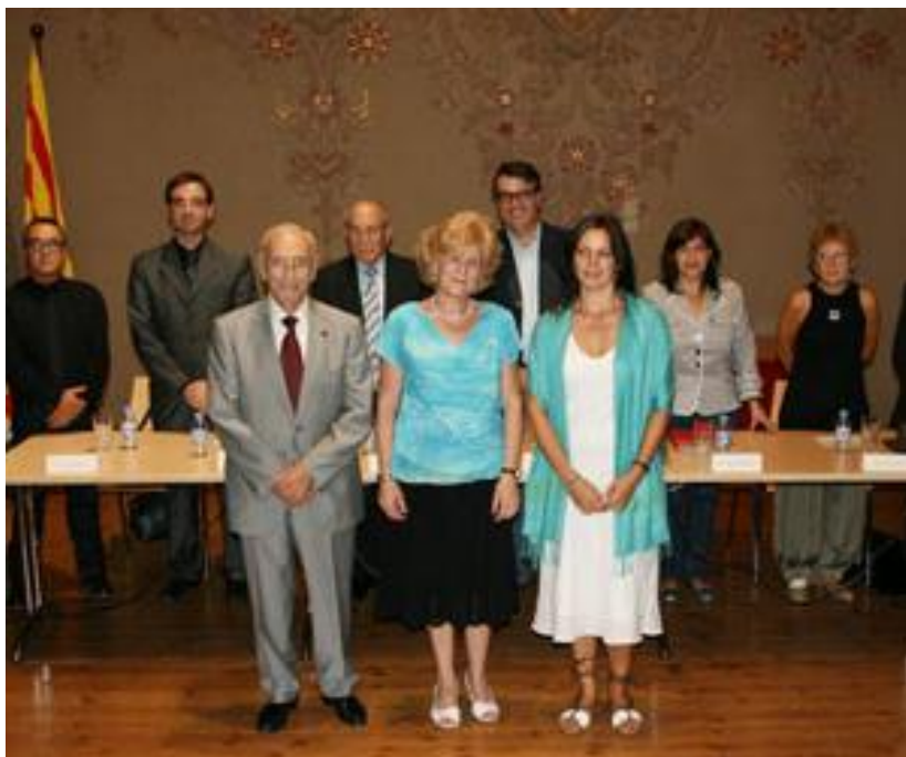
Els guanyadors de l'edició 2010